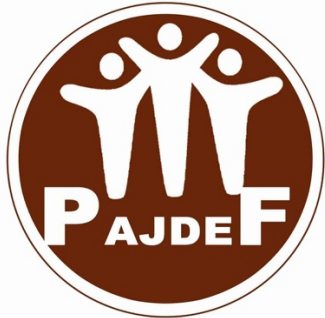
PLATE-FORME D'ACTIONS DE LA JEUNESSE POUR LE DÉVELOPPEMENT DU DÉPARTEMENT DE FERKÉ